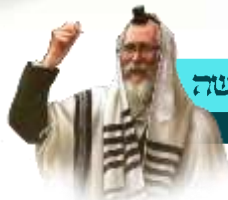
בכל יום ויום יש התגלות חדשה